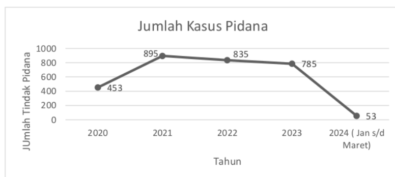
Gambar 1. Data diolah penulis berdasarkan interview pada tanggal 6 Mei 2024.

Penanganan tindak pidana berdasarkan keadilan restoratif di Polresta Kupang dilaksanakan pada kegiatan penyelidikan dan penyidikan. Sejak tahun 2020 sampai Maret 2024, Polresta Kupang telah menangani 3.021 tindak pidana yang diselesaikan dengan pendekatan keadilan restoratif. Sebagian besar tindak pidana diselesaikan pada tingkatan penyelidikan. Hanya beberapa kasus pidana diselesaikan pada tingkatan penyidikan. Berikut data tindak pidana yang diselesaikan melalui keadilan restoratif di Polresta Kupang dari tahun 2020-2024.